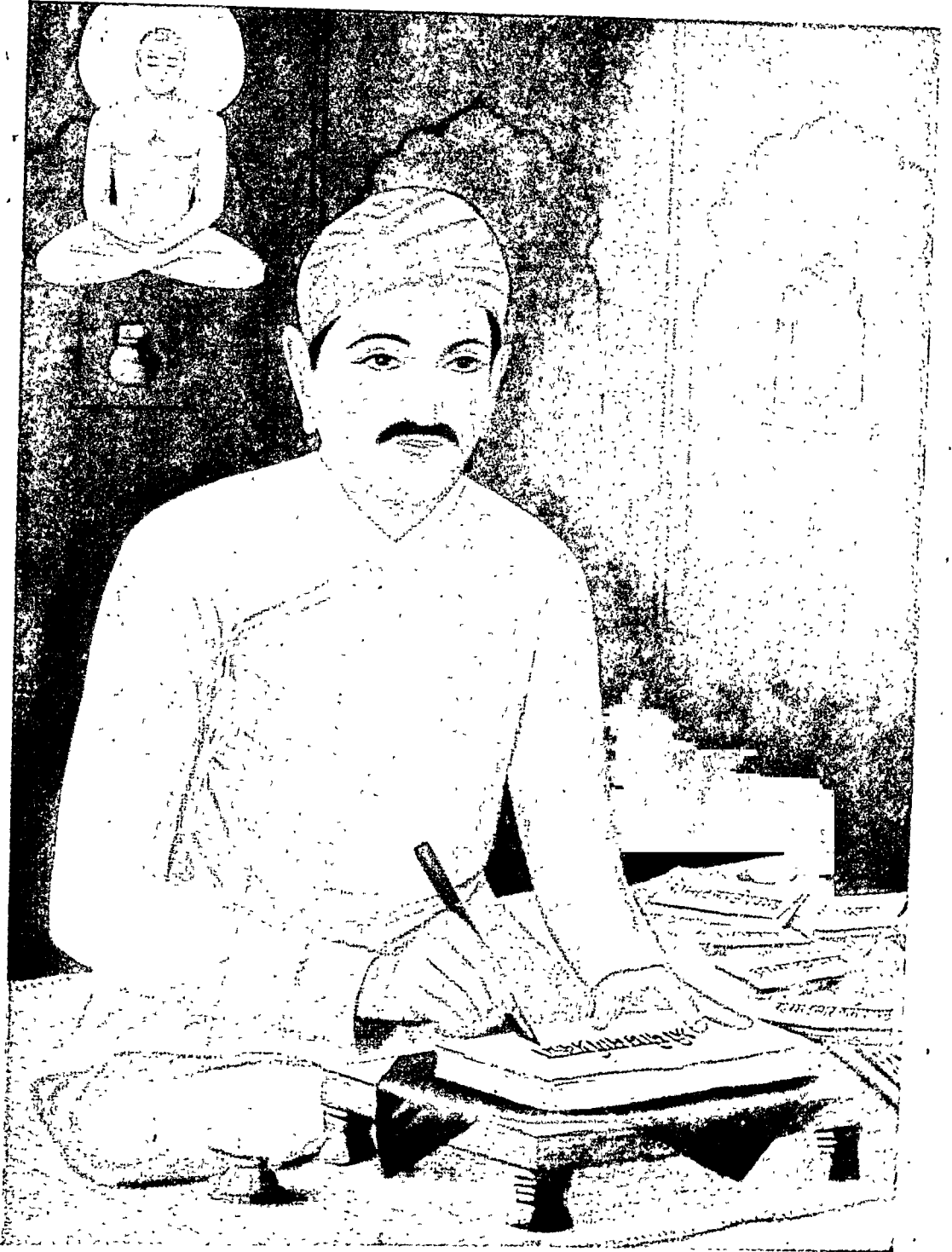
आचार्यकल्प पंडितप्रवर श्री टोडरमलजी